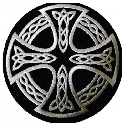
Рисунок 2. Кельтский крест. Символ многих расистских организаций